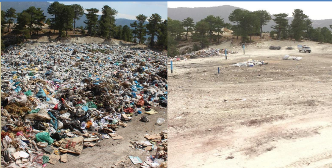
Открито сметище преди и след рехабилитация (Камели, Денизли, Турция)